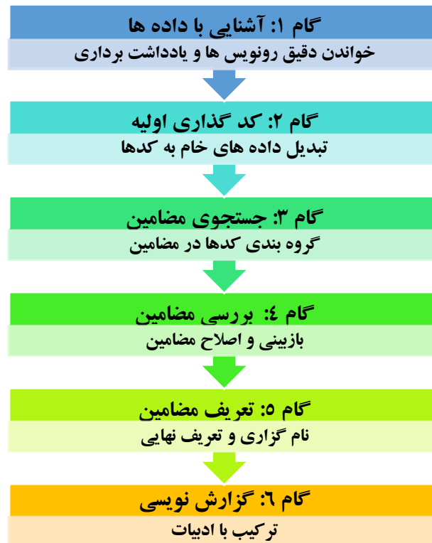
شکل ۱. چارچوب شش مرحله‌ای تحلیل مضمون (Braun & Clarke, 2006)

سیستماتیک است که برای شناسایی الگوهای معنایی و موضوعات عمیق در داده‌های کیفی استفاده می‌شود (Foroozanfar, Imanipour, et al., 2025). شکل ۱ این فرآیند را به تصویر می‌کشد.